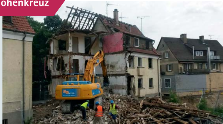
Abbruch der alten Gebäude

Der Wohnungsmix umfasst zehn 2-Zimmer-, eine 3-Zimmer- und drei 4-Zimmer-Wohnungen. Alle Geschosse und die hauseigene Tiefgarage mit elf Stellplätzen sind barrierefrei mit einem Aufzug erreichbar.