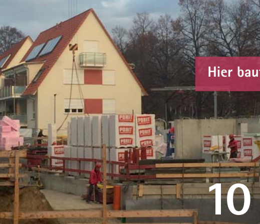
Hier baut die BGE