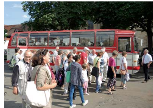
Auf geht's: die BGE-ler vor dem liebevoll restaurierten Mercedes-Bus aus dem Jahr 1970.

Auch im nächsten Jahr wird es wieder eine Stadtführung geben – mehr erfahren Sie in der nächsten Ausgabe Ihrer „Wohnen in ES“.