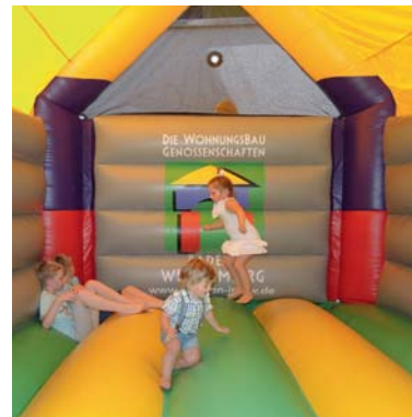
Die Kinder tobten sich in der Hüpfburg aus.