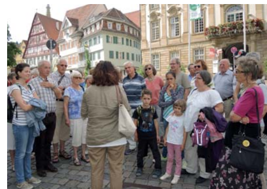
Wissenswertes über die Altstadt: Teilnehmer der Tour vor der Renaissancefassade des Alten Rathauses.