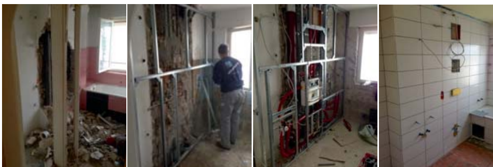
Umbau des Bades im bewohnten Zustand inklusive Grundrissänderung

Die Modernisierung begann in diesem Sommer und wird voraussichtlich im Juli 2016 abgeschlossen. Die BGE investiert rund 1,6 Millionen Euro in das Gebäude: In die Bäder, neue Balkone, Fenster und Türen, die Wärmedämmung des Gebäudes, eine hochwertige Gasbrennwertheizung mit unterstützender Solaranlage, die Sanierung der Treppenhäuser und Eingangsbereiche sowie neu gestaltete Außenanlagen.