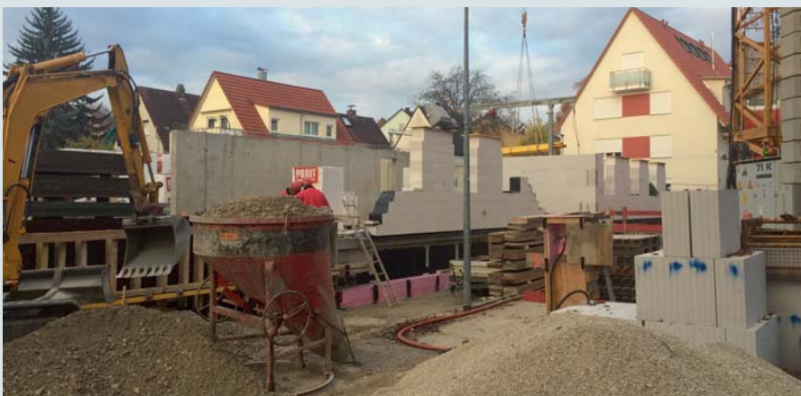
Der Rohbau geht gut voran