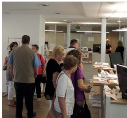
Die Gäste erkundeten die neue BGE-Geschäftsstelle in der Richard-Hirschmann-Straße 12.