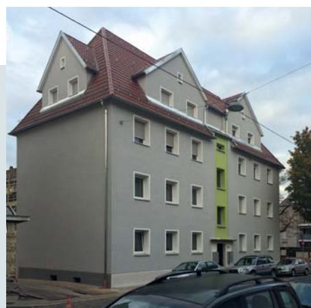
Fertig saniertes Haus in der Hindenburg Straße 98

Dächer und Fassaden werden gedämmt, die Balkone erneuert und Fenster sowie Außentüren ausgetauscht. Ein frischer Fassadenanstrich sowie die Aufwertung der Außenanlagen runden die