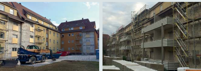
Dächer und Fassaden werden gedämmt