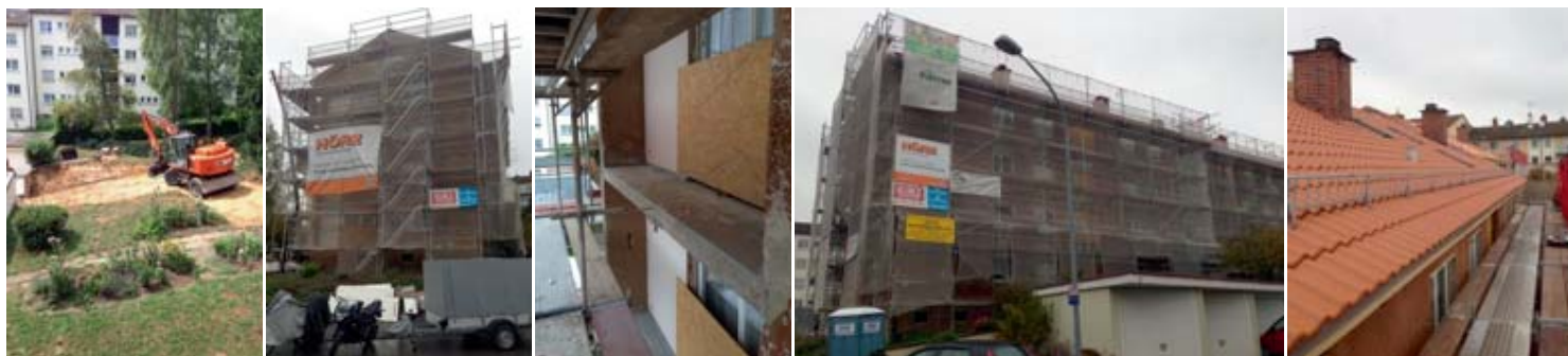
Außenansichten, abgetrennte Balkone, neu eingedecktes Dach

„Toll, wie unsere Mieter mitmachen“, betont Bauleiter Uwe Schlewke. „Besonders die Badsanierungen bedeuten für sie einige Einschränkungen. Dennoch unterstützen sie die Arbeiten, so gut sie können. Offensichtlich überwiegt die Vorfreude auf ihr neues, altes Zuhause.“