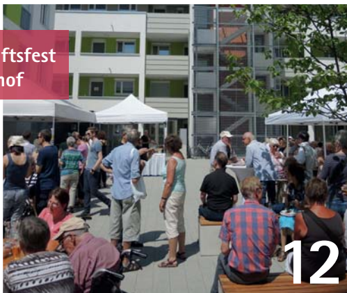
Nachbarschaftsfest im Klarissenhof