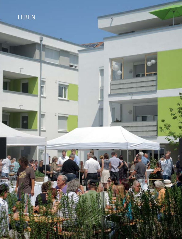
Das Fest bot eine gute Gelegenheit, die Nachbarn näher kennenzulernen.